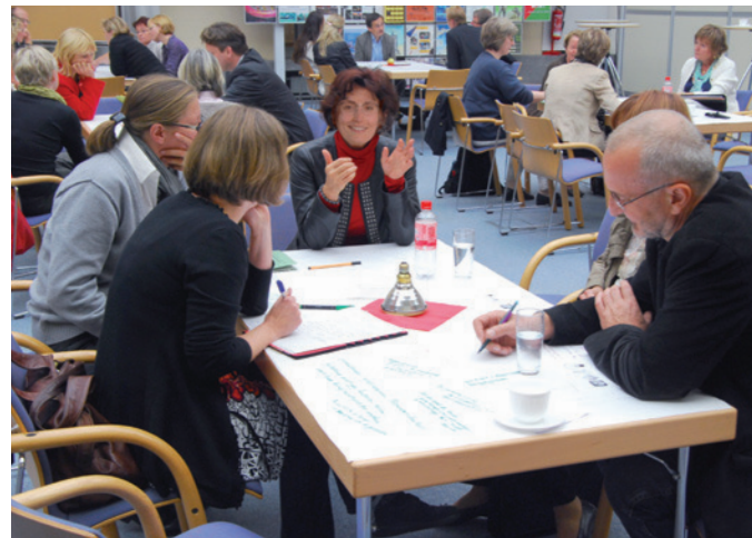
Abbildungen zur Parklandschaft: Büro GROSS.MAX Weitere Abbildungen: Planergemeinschaft

TEMPELHOFER FREIHEIT www.tempelhoferfreiheit.de