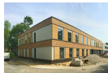
1 Beratungsgebäude für soziale Dienste