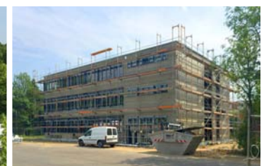
3 Modularer Ergänzungsbau