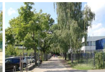
5 Sanierung Hermann-Schmidt-Weg