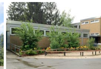
6 Energetische Sanierung Schulgebäude