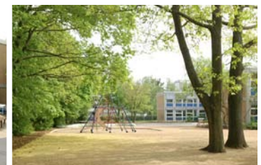
7 Neugestaltung Schulhoffreiflächen