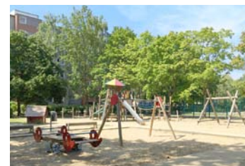
4 Neugestaltung öfftl. Spielplatz